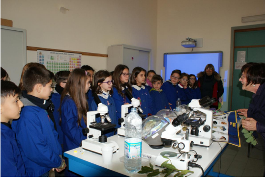
Laboratorio di scienze

Inviato da admin il Mer, 25/01/2012 - 13:17